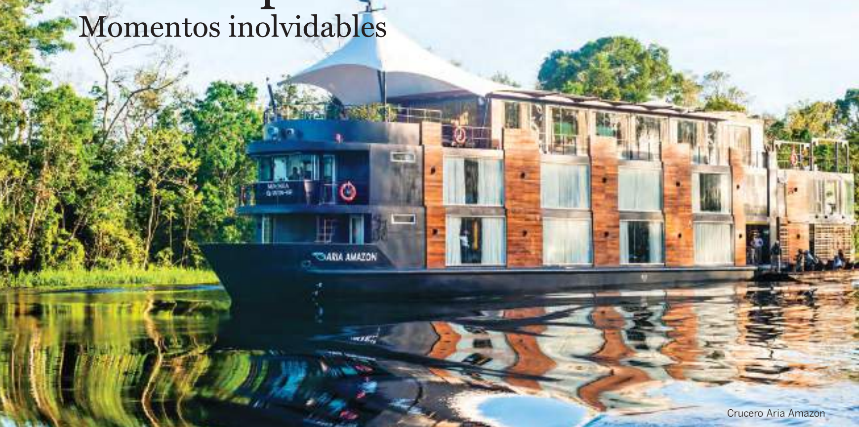
Crucero Aria Amazon