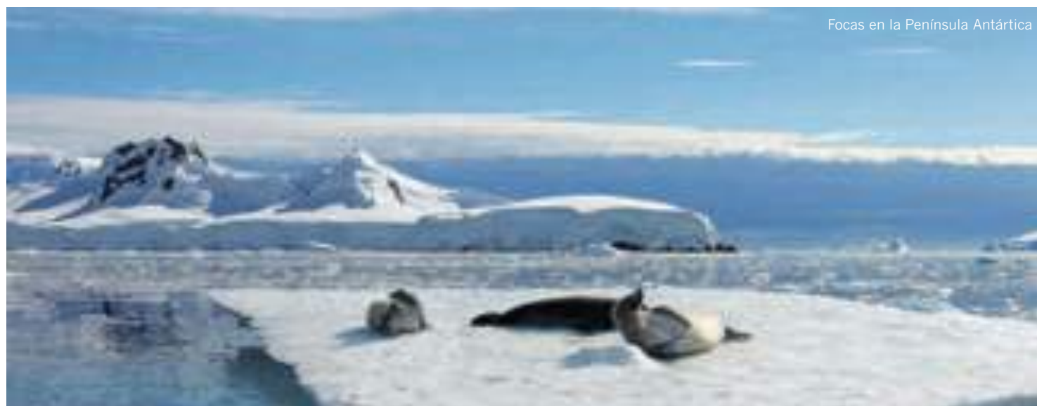
Focas en la Península Antártica

CRUCERO ANTARTICA21 5 noches Ocean Nova Aero-Crucero Antártica Clásica Hebridean Sky- Crucero Antártica Clásica