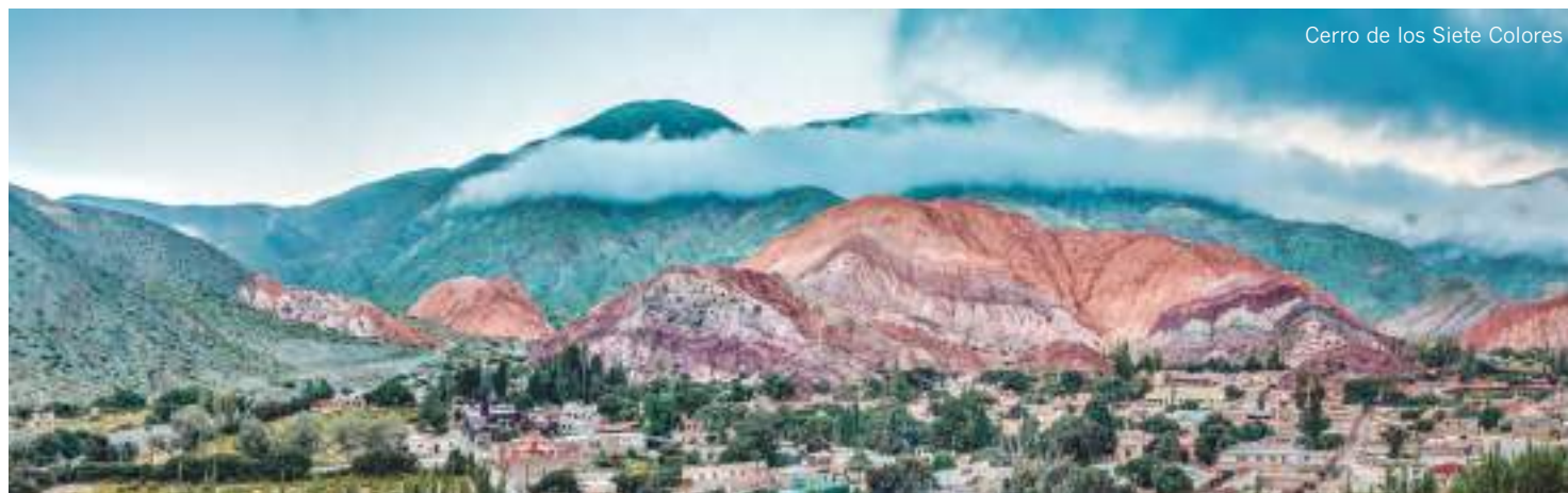
Cerro de los Siete Colores

EL PRECIO INCLUYE: Vuelos de línea regular en clase turista. Alojamiento y desayuno en los hoteles seleccionados. Tasas y entradas a los Parques Nacionales. Consultar otras combinaciones. Tasas aéreas 525 €. Seguro y set de viaje TANDEM Luxury Travel. Suplemento en hotel Awasi de Iguazú 1.499 € por persona total estancia.