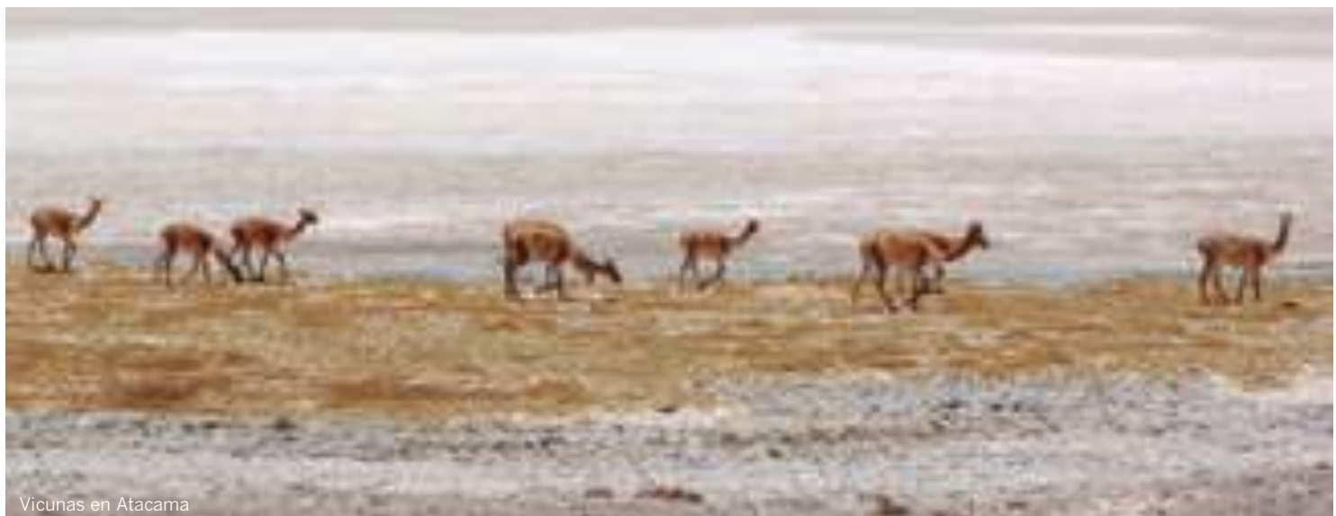
Vicuñas en Atacama

TORRES DEL PAINE 3 noches Explora Patagonia Tierra Patagonia Awasi Patagonia