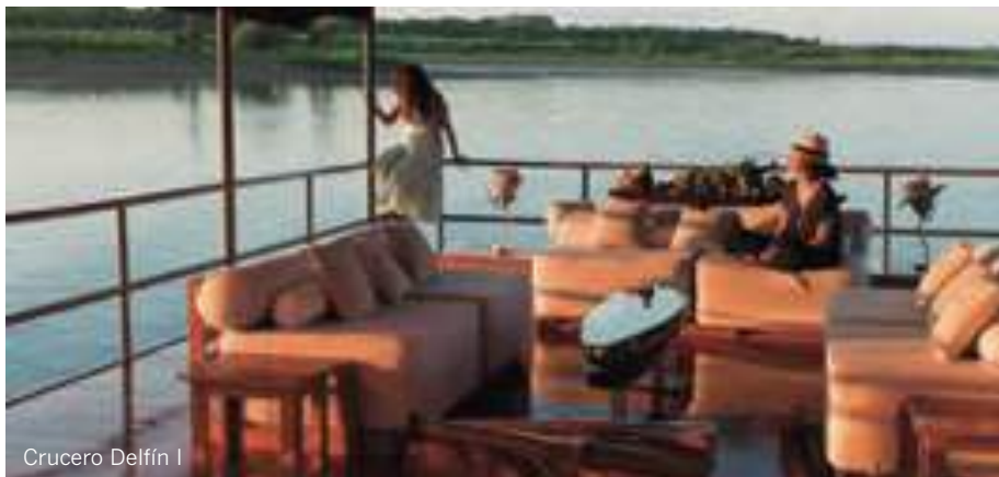
Crucero Delfín I

NO TE PUEDES PERDER: Ver amanecer en la ciudadela de Machu Picchu: las primeras neblinas se disiparán con el primer rayo de sol, a modo de telón, para mostrarnos la belleza de la Ciudad Perdida. Subida a Huayna Picchu para tener una perspectiva diferente de la ciudadela, de modo que podemos ver que ésta tiene forma de cóndor, adorado por los incas.