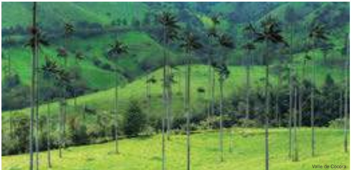
Valle de Cocora

EL PRECIO INCLUYE: Precio en base a 4 personas. Vuelos de línea regular en clase turista. Alojamiento y desayuno en los hoteles seleccionados y tres almuerzos, traslado y excursiones guiadas en privado y en castellano. Tasas y entradas a los Parques Nacionales. Consultar otras combinaciones. Tasas aéreas 86 €. Seguro y set de viaje TANDEM Luxury Travel.